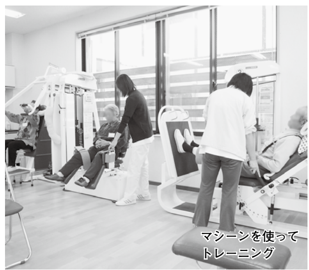
マシンを使って トレーニング