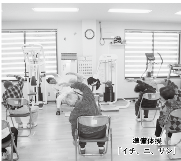
準備体操 「イチ、ニ、サン」