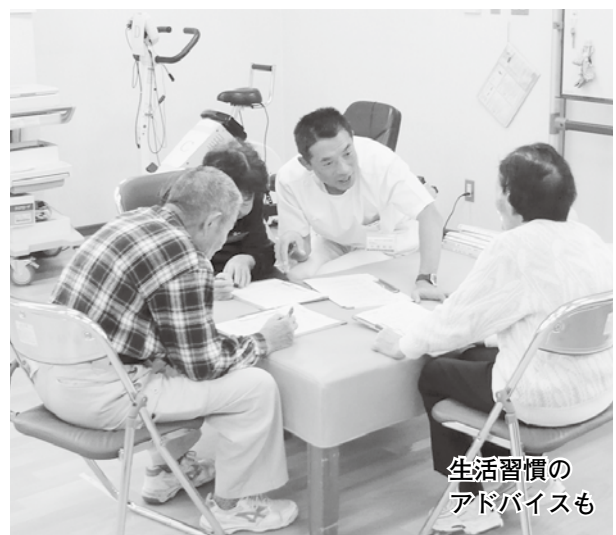
生活習慣の アドバイスも

城内診療所では、通常のリハビリの他に市からの委託を受け、介護予防事業のうち「筋力向上トレーニング事業」を理学療法士・看護師が行っています。パワーリハビリ機器での運動や自宅でもできる転倒予防体操等を行うことで、自立した生活を続けるために必要な筋力や運動機能の向上をはかります。(介護予防事業については、市地域包括支援センターにお問い合わせください。)