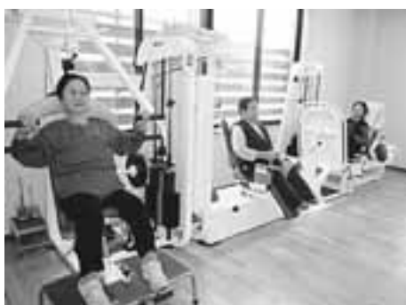
『パワーリハは、楽しくトレーニング』

あよねさん 「松っあん、疲れたろー。」 松っあん 「なあんし。楽しいて。女しよがにぎやかだすけ。」 「ところで、パワーリハに来ているしよの中で、いっち歳が上の人は幾つだるか。」 あよねさん 「診療所の送迎バスを利用して来るしよの中に、男の人で 95歳、女の人で 92歳の人がいると。」 松っあん 「ほっか。ということは、オレはまだ若手のほうだなー。よっし！」 ... 4月からさらに闘志を燃やす松っあん 85歳、 “ニヤッ” とする。