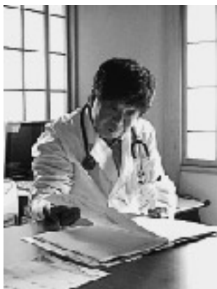
(患者様宅にて診療)

当診療所では在宅で寝たきりの方や介護が必要な方にとって、安心して自宅療養ができるように訪問診療を行っています。訪問診療は在宅医療サービスのひとつで、診療計画を立て医学的管理に基づいて、主治医と看護師が定期的に訪問します。患者様の病状に応じて訪問する回数は異なりますが、通常は月1回から2回程度です。定期の訪問診療以外に発熱などの急な症状がある場合は往診を行います。訪問看護ステーションと連携をとりながら、在宅療養生活をサポートします。