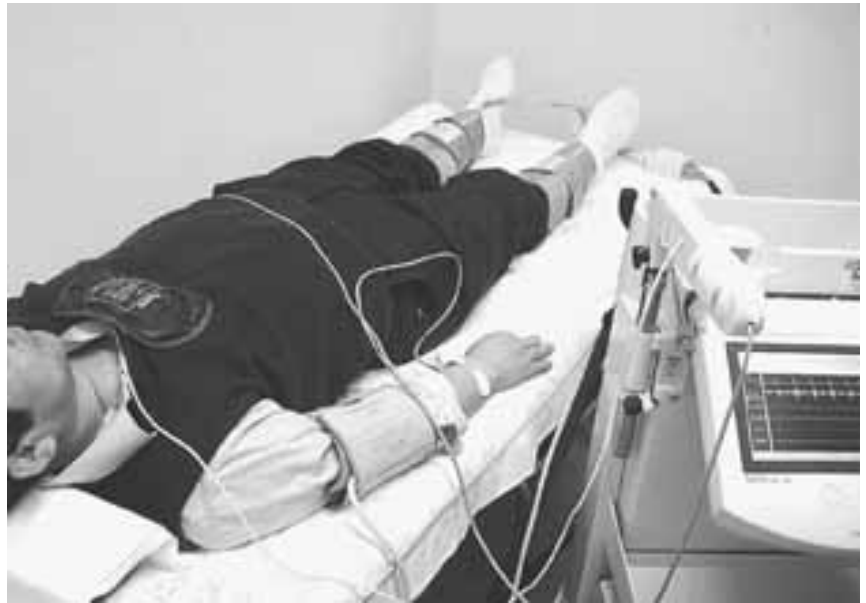
動脈硬化検査測定の様子