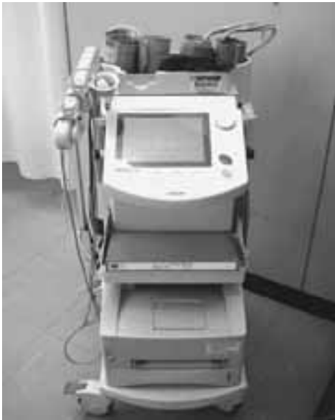
血圧脈派検査装置