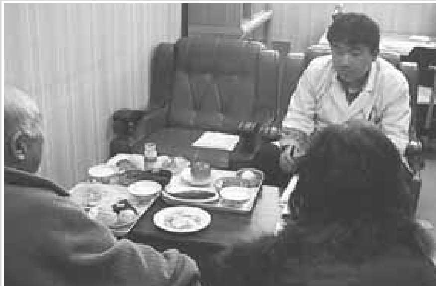
フードモデルを使ったの栄養指導

疾病予防に向けて 『疾病予防』は今年の城内病院のテーマです。 生活習慣病の予防のため、運動不足・カロリー過摂取などを見直しを私たちスタッフと一緒に取り組んでいきましょう。