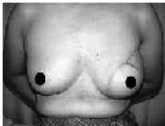
腹部の皮膚と筋肉による再建