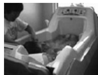
足を伸ばして入浴できます