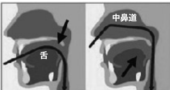
舌根部に当たらないので咽頭反射が起きにくい

南魚沼市立ゆきぐに大和病院 【ホームページ】 http://www.city.minamiuonuma.niigata.jp 【E-mail】 yukiguni@mail.tiara.or.jp ※南魚沼市のホームページが表示されますので、健康・福祉>市立病院など と進んでください。