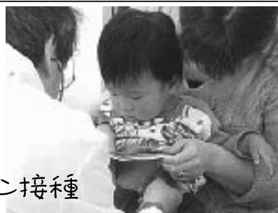
ポリオワクチン接種